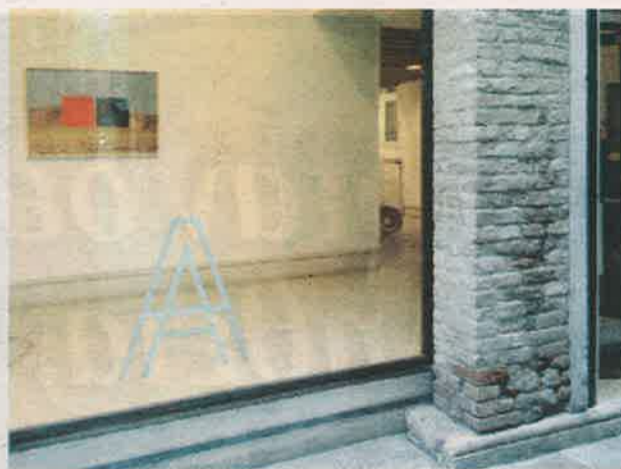
A plus A Gallery.

και σε εύρος καλλιτεχνικής δημιουργίας. Με συναινετικό πνεύμα και καλή διάθεση συνεργαστήκαμε στενά, επί 4 μήνες, και οι οκτώ, και μέσα από ένα εξαντλητικό, αλλά παράλληλα εποικοδομητικό, καθημερινό brainstorming ολοκληρώσαμε το έργο μας. Αναμφισβήτητα, η εργασιακή διαδικασία μεταξύ οκτώ ανθρώπων, και δη από διαφορετικές χώρες, απαιτεί συντονισμό, συστηματική δουλειά και συνεχή μεταξύ τους ενημέρωση. Χωρίς ίχνος, όμως, ανταγωνισμού, με τις απαραίτητες δημιουργικές διαφωνίες μας, που οδήγησαν σε επιτυχημένη υλοποίηση της έκθεσης, δεν θα μπορούσα παρά μόνο άψογη να χαρακτηρίσω τη συνεργασία μας.