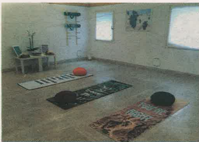
The Cool Couple, «Karma Fails», 2016, site specific installation.